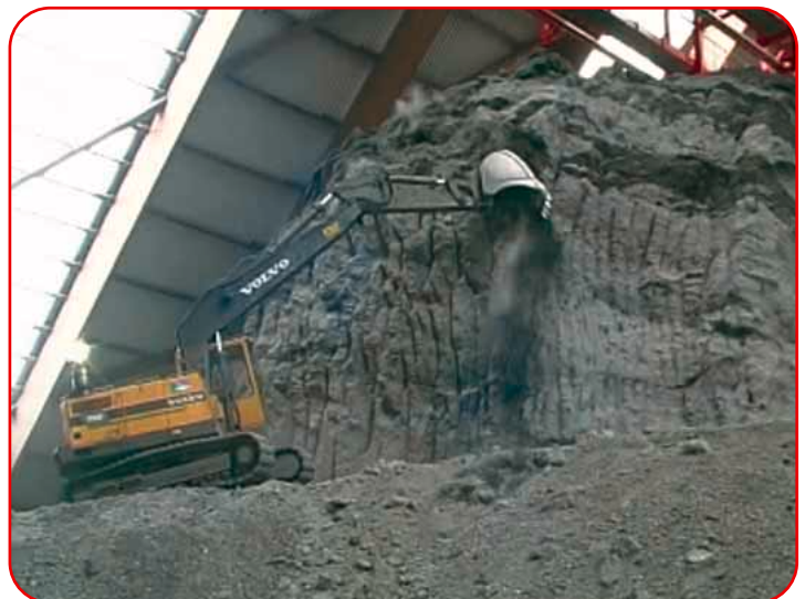
Die Schlackenhalden in der MVR

Wie schon im letzten Jahr wird emvau-schlacke auch 2005 stark nachgefragt. Um mögliche Engpässe zu vermeiden, bitten die HSK ARGE Vertrieb ihre Kunden, möglichst frühzeitig ihren Bedarf mitzuteilen, um rechtzeitig Lieferengpässen vorbeugen zu können.