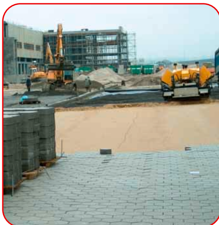
Auch bei ungünstigen Witterungsbedingungen kann emvau-schlacke gut eingebaut werden und ist danach sofort belastbar

Last but not least ist herauszustellen, dass emvau-schlacke einen äußerst konkurrenzfähigen Preis hat. In Zeiten knapper Kassen vielleicht das entscheidende Argument für emvau-schlacke.