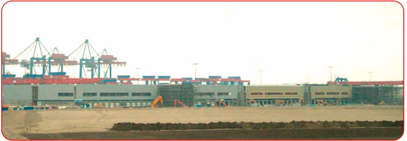
Das neue Kühne & Nagel-Logistikzentrum im Hamburger Hafen. Im Hintergrund ist das HHLA CTA, das modernste Containerterminal der Welt, zu sehen

Im Hamburger Hafen befindet sich das neue Kühne & Nagel-Logistikzentrum. Der 380 m lange und 90 m breite Hallenkomplex umfasst fünf Hallen mit 30.000 m 2 Lagerfläche. Mit Verlade- und Rangierflächen im Außenbereich sowie den Büroflächen umfasst das Logistikzentrum 70.000 m 2 . Um den Außenflächen und dem Hallenboden eine hohe Tragfähigkeit zu verleihen, wurden auf dem Gelände insgesamt 30.000 Tonnen emvau-schlacke eingebaut.